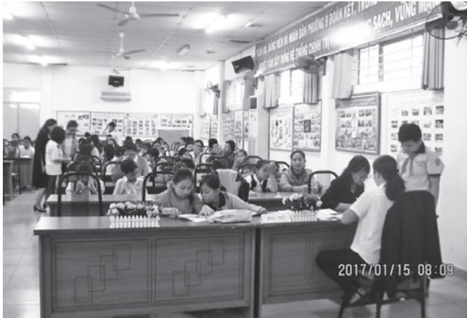
奨学金は一人一人子どもたちに手渡しされます

1月15日にホーチミン市の里子が集まり、奨学金の支給が行われました。奨学金は直接子どもたちに現金で渡されました。ホーチミン市以外の子どもたちは地方にあるそれぞれの奨学会から奨学金が渡されます。奨学金が子どもたちの明るい未来のために役に立てばうれしいですね！ 皆さまご支援ありがとうございました！