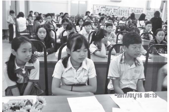
奨学金を待つ子どもたち