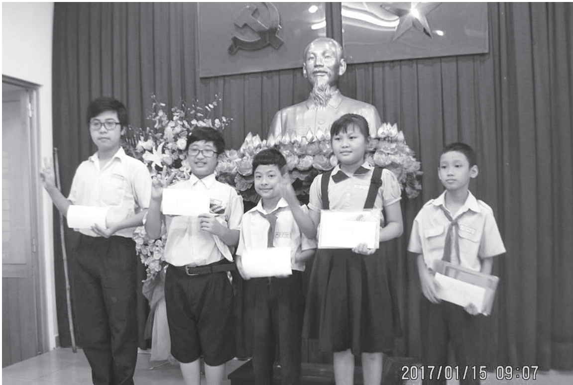
青葉奨学会から奨学金をもらい喜ぶ子どもたち（ホーチミン市）